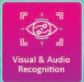
Visual & Audio Recognition