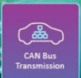
CAN Bus Transmission