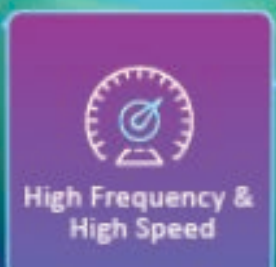
High Frequency & High Speed