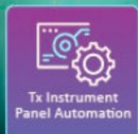
Tx Instrument Panel Automation