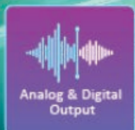
Analog & Digital Output